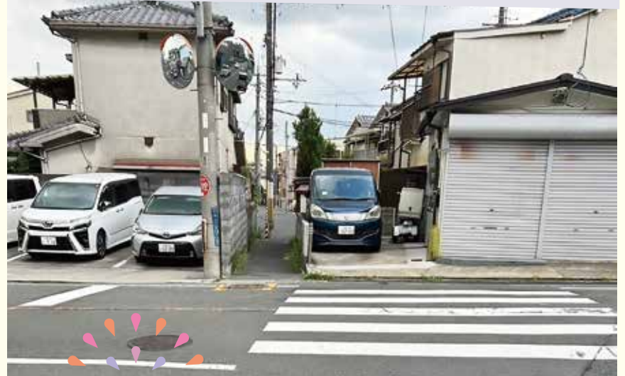
大東市北条地域路面標示