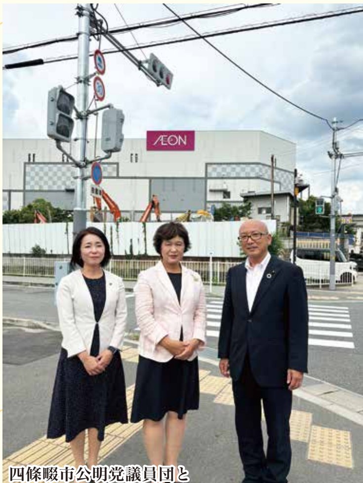
四條畷市公明党議員団と