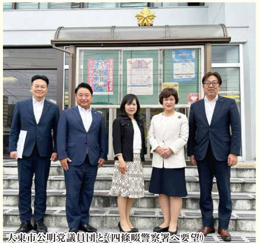
大東市公明党議員団と(四條畷警察署へ要望)