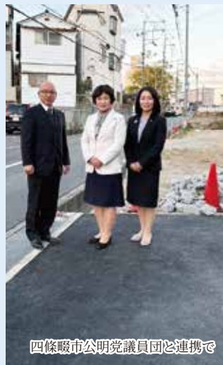
四條畷市公明党議員団と連携で

歩行者や自転車の安全確保に向け、旧国道170号線の歩道整備を推進。工事着手に向けて、地下埋設物の管理者など関係機関との協議を進め、市と連携しながら整備に取り組んでいます。