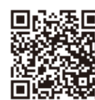
子ども・大学生等への食費支援事業

ココがポイント 府の物価高対策は特定の世代に支援が偏っているため、公明府議団は高齢者や障がい者、ひとり親家庭など幅広い層への支援を重ねて要望してきました。イラン情勢の懸念も踏まえ、追加の支援策を強く求めてまいります。