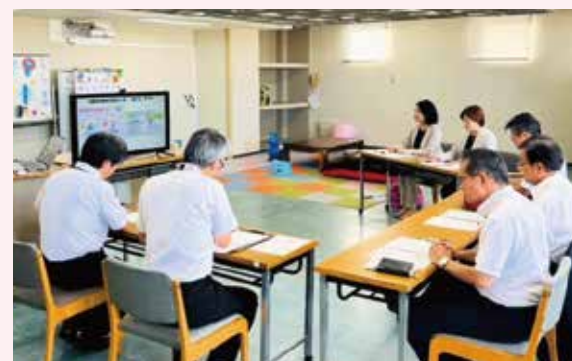
▲不登校支援センター「まいど」を視察

ココがポイント 公明府議団は、小中学校へのスクールカウンセラーの常駐化、高校の居場所づくりの拡充、窓明分校を全国のモデルとするための支援強化に取り組んでまいります。