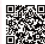
賃上げ促進支援パッケージ